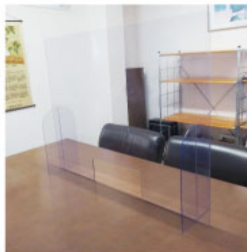
足もすべて透明なので視界がクリア!